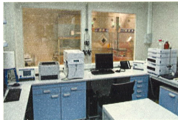
Laboratorij za kontrolu kvalitete