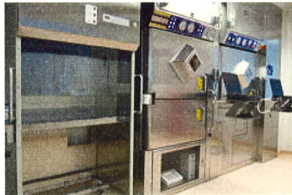
Vruće ćelije za proizvodnju FDG